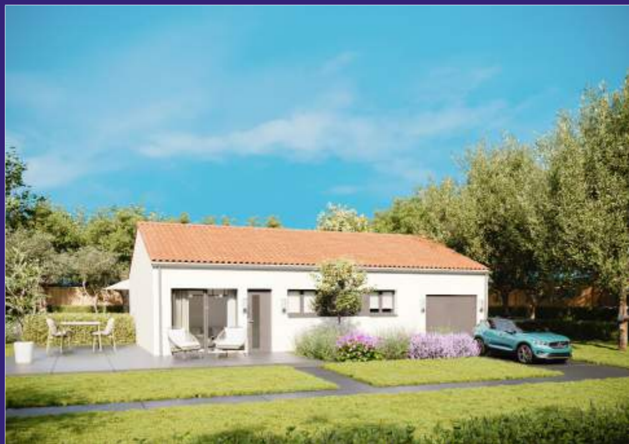
Évolutis - Aqualy