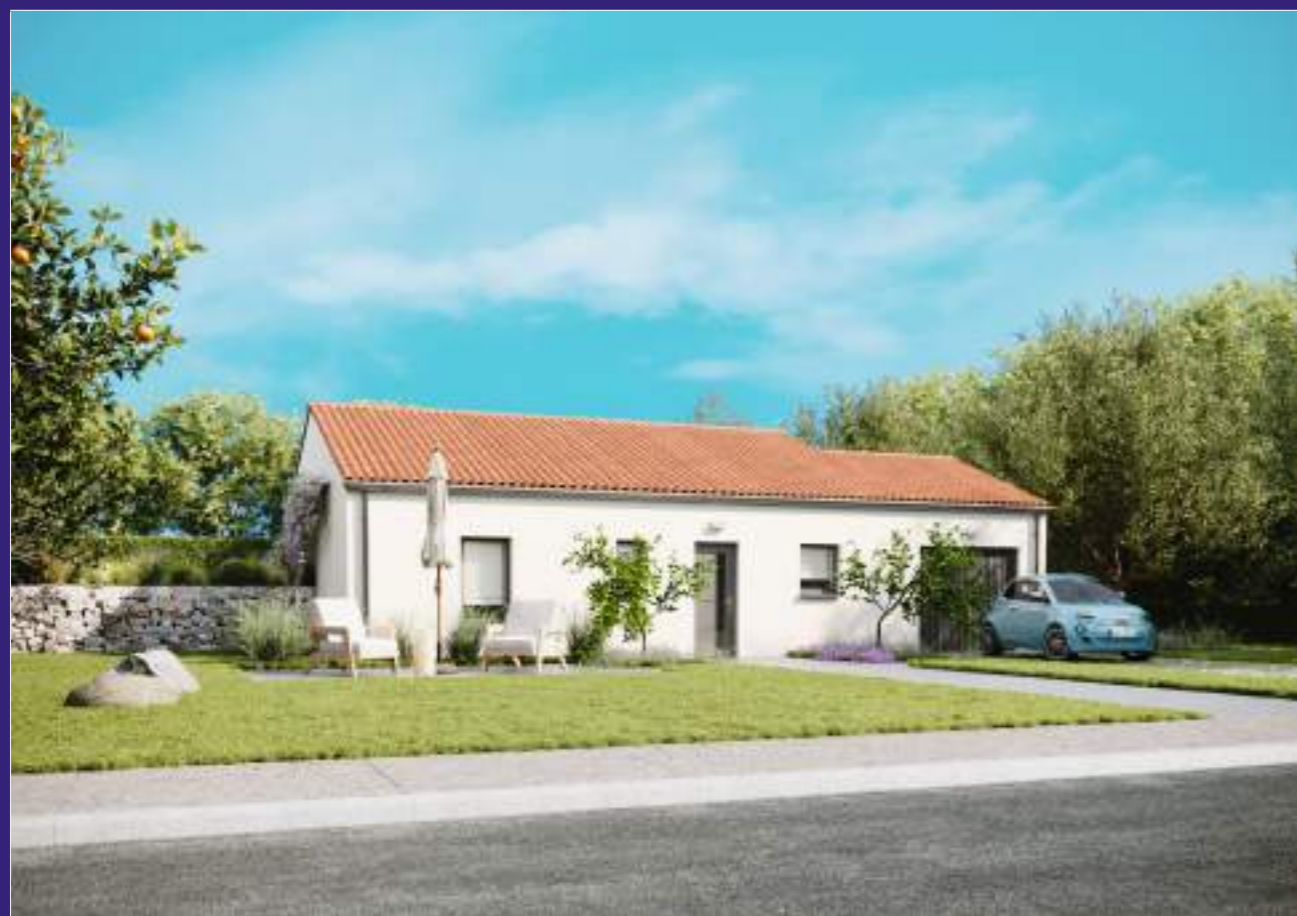
Focus - Sirius